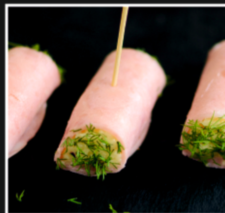
РУЛЕТКИ С ВЕТЧИНОЙ И СЫРОМ