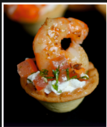
МИНИ ТАРТАЛЕТКИ С КРЕВЕТКОЙ, СЫРНЫМ КРЕМОМ И ТОМАТНОЙ САЛЬСОЙ