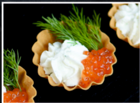
ТАРТАЛЕТКИ С КРАСНОЙ ИКРОЙ И СЫРНЫМ КРЕМОМ

Тарталетки – это маленькие корзиночки из теста, которые можно наполнить разнообразной начинкой, например, фруктами, соусами, мясом или овощами.