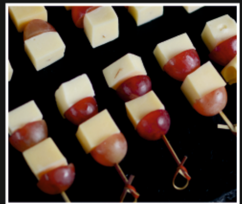
КАНАПЕ С СЫРОМ И СЕЗОННОЙ ЯГОДОЙ