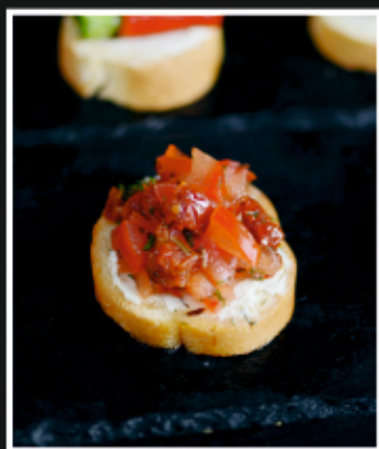
БРУСКЕТТА С ТОМАТНОЙ САЛЬСОЙ И БАЛЬЗАМИЧЕСКИМ КРЕМОМ