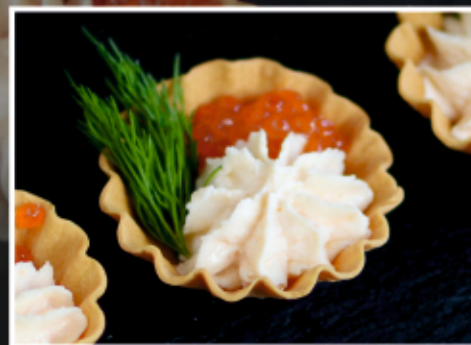
ТАРТАЛЕТКИ С КРЕМОМ ИЗ ЛОСОСЯ И КРАСНОЙ ИКРОЙ