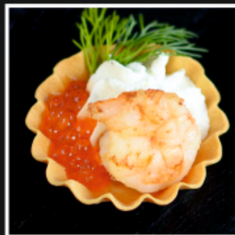
ТАРТАЛЕТКИ С КРЕВЕТКОЙ, КРАСНОЙ ИКРОЙ И СЫРНЫМ КРЕМОМ