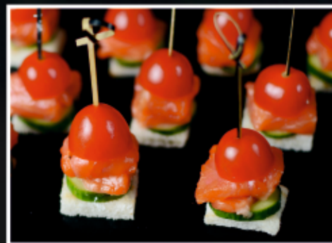
КАНАПЕ С СЕМГОЙ, ОГУРЦОМ И СЛИВОЧНЫМ КРЕМОМ