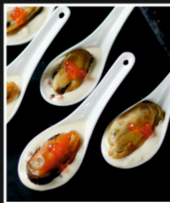
МИДИИ В СЛИВОЧНО-ИКОРНОМ СОУСЕ