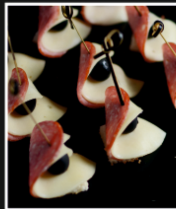
КАНАПЕ С СЕРВИЛАТОМ, СЫРОМ И МАСЛИНОЙ