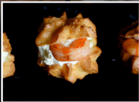
ПРОФИТРОЛИ С СЫРНЫМ КРЕМОМ И КРЕВЕТКАМИ