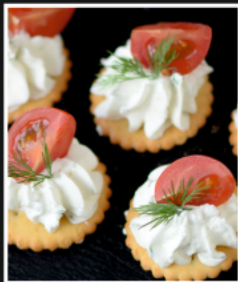
КРЕКЕР С СЫРНЫМ КРЕМОМ И ЧЕРРИ