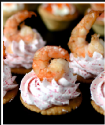
КРЕКЕР С СЫРНЫМ КРЕМОМ, ТОБИКО И КРЕВЕТКОЙ