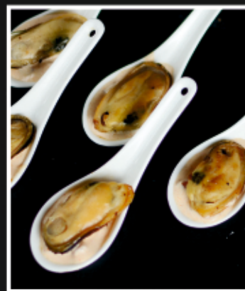
МИДИИ В ТАЙСКОМ СОУСЕ