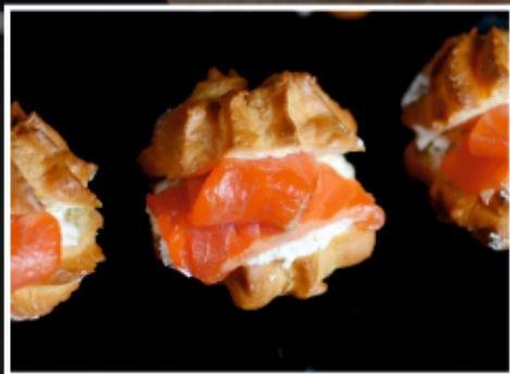
ПРОФИТРОЛИ С СЫРНЫМ КРЕМОМ И СЕМГОЙ

Креке́ры — сухое английское печенье, которое подается в качестве закуски