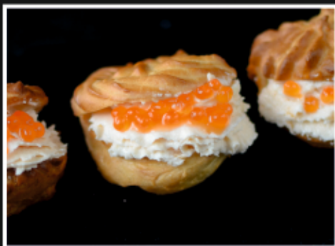
ПРОФИТРОЛИ С КРЕМОМ ИЗ ЛОСОСЯ И КРАСНОЙ ИКРОЙ