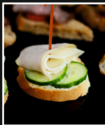
БРУСКЕТТА С КУРИНОЙ ГРУДКОЙ И СЫРОМ СУЛУГУНИ