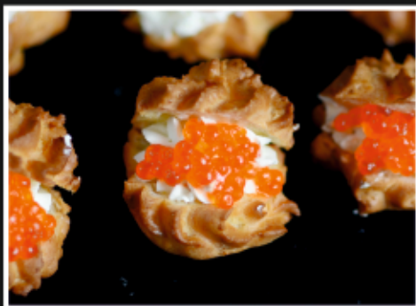
ПРОФИТРОЛИ С КРАСНОЙ ИКРОЙ