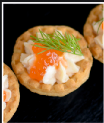
МИНИ ТАРТАЛЕТКИ С КРЕМОМ ИЗ ЛОСОСЯ И КРАСНОЙ ИКРОЙ