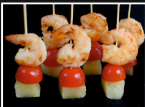
КАНАПЕ С КРЕВЕТКОЙ, АНАНАСОМ И ЧЕРРИ