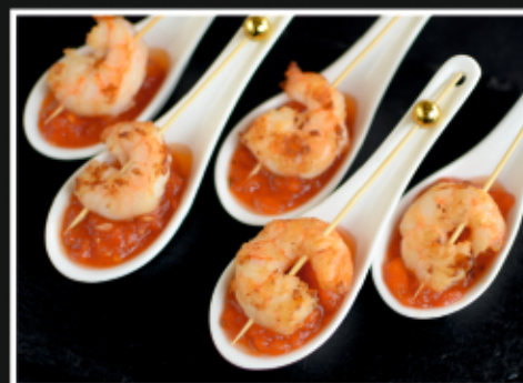
КАНАПЕ С КРЕВЕТКОЙ В ФИРМЕННОМ ТОМАТНОМ СОУСЕ