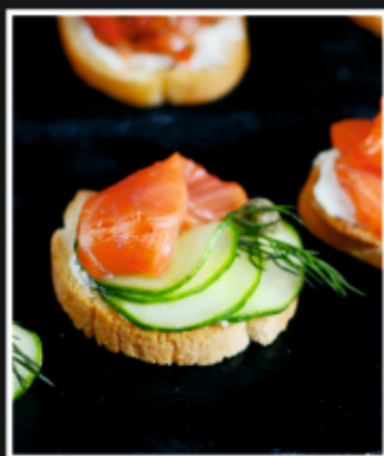
БРУСКЕТТА С СЕМГОЙ, ОГУРЦОМ И СЫРНЫМ КРЕМОМ