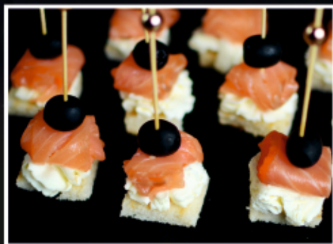
КАНАПЕ ИЗ КОПЧЕНОГО ЛОСОСЯ И СЛИВОЧНОГО КРЕМА

Крошечные бутерброды массой 10-30 г, толщиной 0,5-7 см. Бутербродики из гренок, нарезанных разной съестной основы, насаженные на шпажки, которые можно отправлять в рот целиком, не откусывая по кусочку.