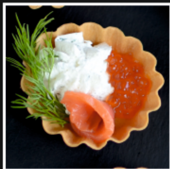
ТАРТАЛЕТКИ С СЕМГОЙ, КРАСНОЙ ИКРОЙ И СЛИВОЧНЫМ КРЕМОМ