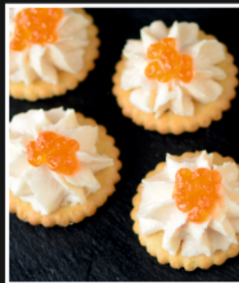
КРЕКЕР С КРЕМОМ ИЗ ЛОСОСЯ И КРАСНОЙ ИКРОЙ