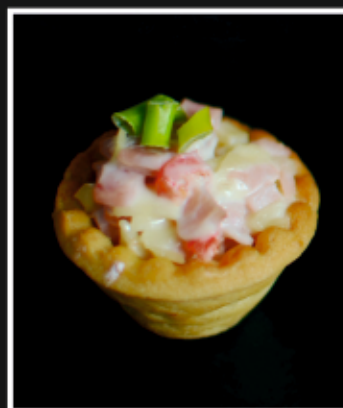
МИНИ ТАРТАЛЕТКИ С ВЕТЧИНОЙ И СЫРОМ