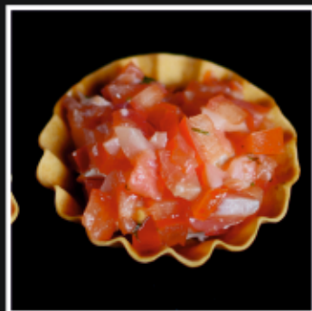
ТАРТАЛЕТКИ С СЕМГОЙ И ТОМАТНОЙ САЛЬСОЙ