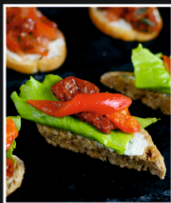
БРУСКЕТТА С ПЕЧЕНЫМ ПЕРЦЕМ И ВЯЛЕНЫМИ ТОМАТАМИ