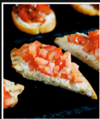
БРУСКЕТТА С СЕМГОЙ И ТОМАТНОЙ САЛЬСОЙ

Брускетта — классическая итальянская закуска-антипасто, представляющая собой ломтик подсушенного хлеба, поджаренный до легкой корочки и хрустящего состояния.