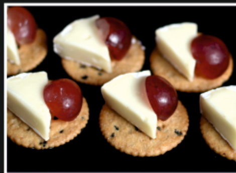
КРЕКЕР С СЫРОМ «БРИ» И СЕЗОННОЙ ЯГОДОЙ