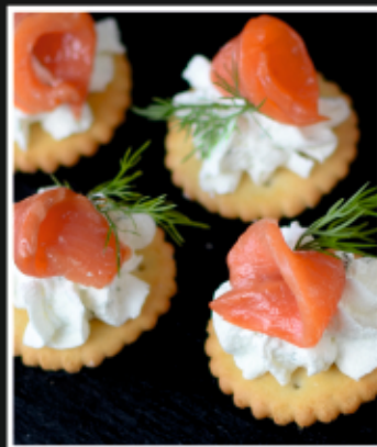
КРЕКЕР С СЕМГОЙ И СЫРНЫМ КРЕМОМ