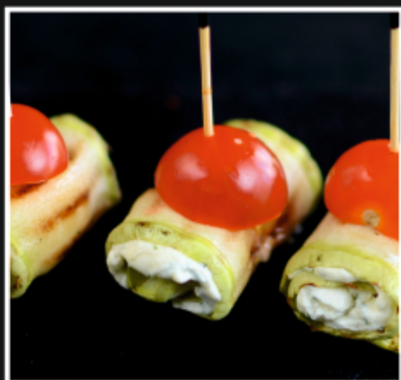
РУЛЕТКИ ИЗ ЦУКИНИ С СЫРНЫМ КРЕМОМ