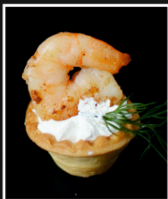
МИНИ ТАРТАЛЕТКИ С КРЕВЕТКОЙ, СЫРНЫМ КРЕМОМ