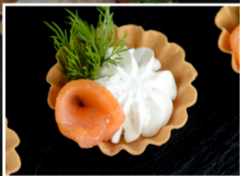
ТАРТАЛЕТКИ С КОПЧЕНОЙ СЕМГОЙ И СЛИВОЧНЫМ КРЕМОМ