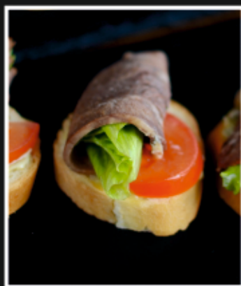
БРУСКЕТТА С ГОВЯЖЬИМ ЯЗЫКОМ И СОУСОМ ТАРТАР