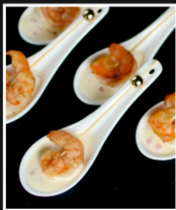
КАНАПЕ С КРЕВЕТКОЙ В СЛИВОЧНО-ИКОРНОМ СОУСЕ