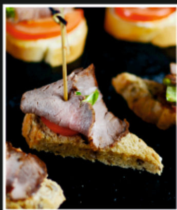
БРУСКЕТТА С РОСТБИФОМ И УСТРИЧНЫМ СОУСОМ