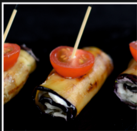
РУЛЕТКИ ИЗ БАКЛАЖАНОВ С СЫРНЫМ КРЕМОМ