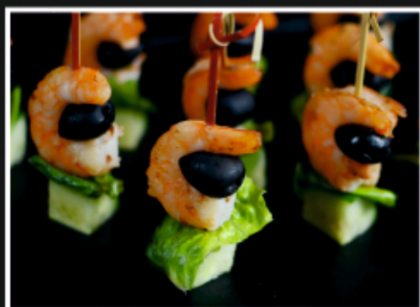
КАНАПЕ С КРЕВЕТКОЙ, ОГУРЦОМ И МАСЛИНОЙ