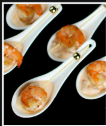
КАНАПЕ С КРЕВЕТКОЙ В ТАЙСКОМ СОУСЕ