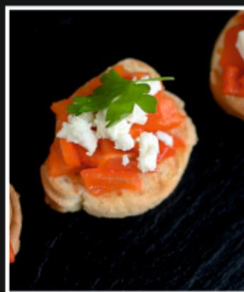
БРУСКЕТТА С СЫРОМ ФЕТА И ПЕЧЕНЫМ ПЕРЦЕМ