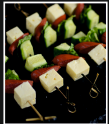
КАНАПЕ С ОХОТНИЧЬИМИ КОЛБАСКАМИ