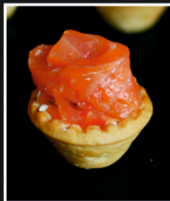
МИНИ ТАРТАЛЕТКИ С КОПЧЕНОЙ СЕМГОЙ И СЛИВОЧНЫМ КРЕМОМ