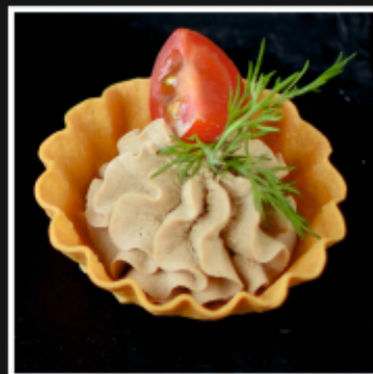
ТАРТАЛЕТКИ С ПАШТЕТОМ ИЗ КУРИНОЙ ПЕЧЕНИ И ЧЕРРИ