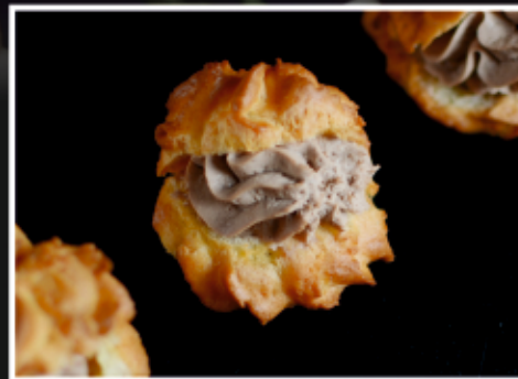
ПРОФИТРОЛИ С ПАШТЕТОМ ИЗ КУРИНОЙ ПЕЧЕНИ