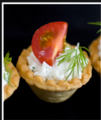
МИНИ ТАРТАЛЕТКИ С СЫРНЫМ КРЕМОМ И ПОМИДОРАМИ ЧЕРРИ