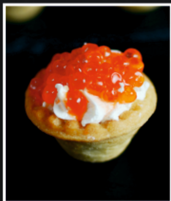
МИНИ ТАРТАЛЕТКИ С КРАСНОЙ ИКРОЙ

Тарталетки – это маленькие корзиночки из теста, которые можно наполнить разнообразной начинкой, например, фруктами, соусами, мясом или овощами.