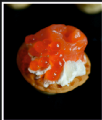
МИНИ ТАРТАЛЕТКИ С СЕМГОЙ, КРАСНОЙ ИКРОЙ И СЛИВОЧНЫМ КРЕМОМ