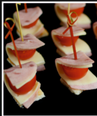
КАНАПЕ С ВЕТЧИНОЙ