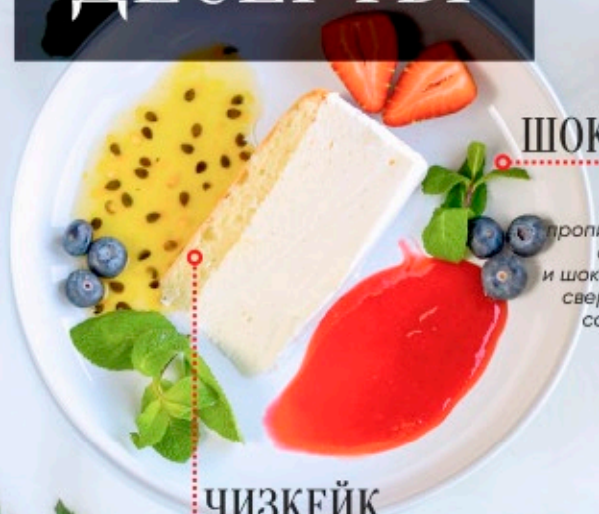
ЧИЗКЕЙК КЛАССИЧЕСКИЙ 170г - 320P-