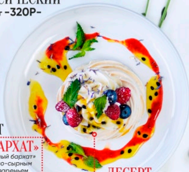
ДЕСЕРТ ПАВЛОВОЙ Воздушное бэзе в сочетании с сырным кремом, пюре маракуйя, клубничным соусом и свежими ягодами 200г - 375P-