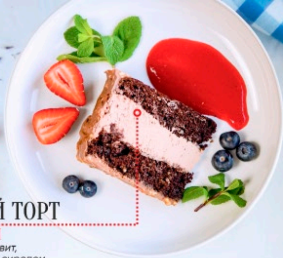
ШОКОЛАДНЫЙ ТОРТ С МАЛИНОЙ Шоколадный бисквит, пропитанный сахарным сиропом, сливочно-сырный крем и шоколадная глазурь с арахисом сверху. Подается с малиновым соусом и свежими ягодами 235г - 360P-