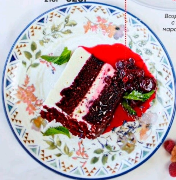
ДЕСЕРТ «КРАСНЫЙ БАРХАТ» Нежный бисквит «красный бархат» в сочетании с сливочно-сырным кремом и вишневым вареньем 210г - 320P-