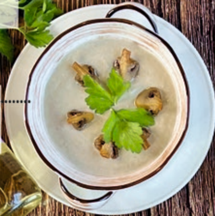
Суп шоре грибной 300 г 330 р