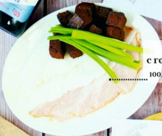
Сало с горчичными гренками 100/80 г 240 р.