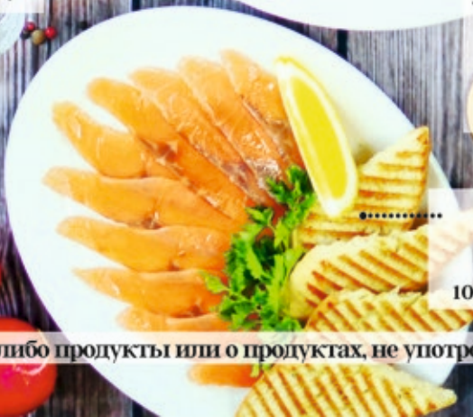
Балыки семги 100/50 г 510 р.

Пожалуйста сообщите официанту об аллергии на какие либо продукты или о продуктах, не употребляемых Вами в пищу