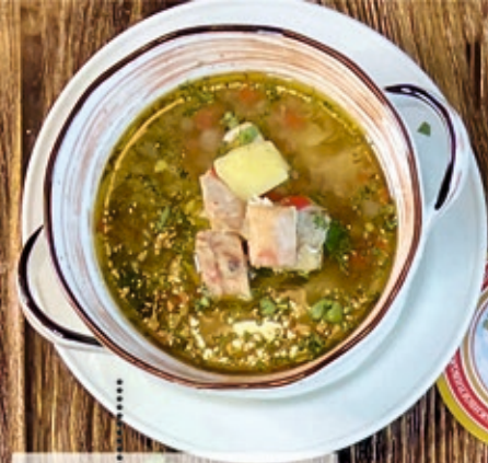
Уха Астраханская 300 г 390 р