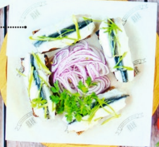
Килька на ржаных тостах 180/30 г 270 р.