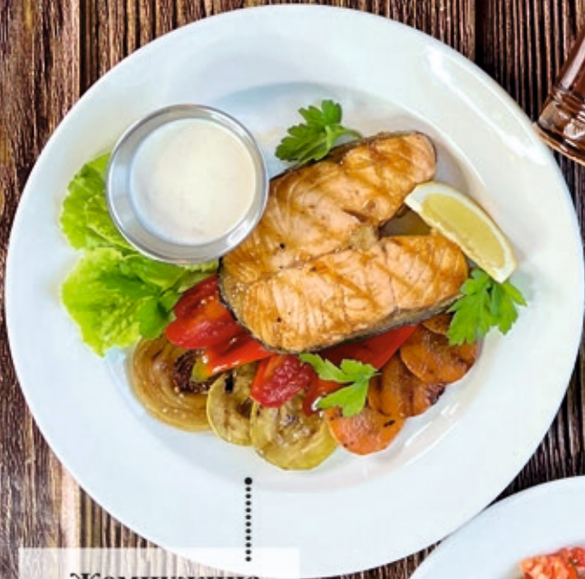
Жемчужина моря 200/120/50 г 1150 р.