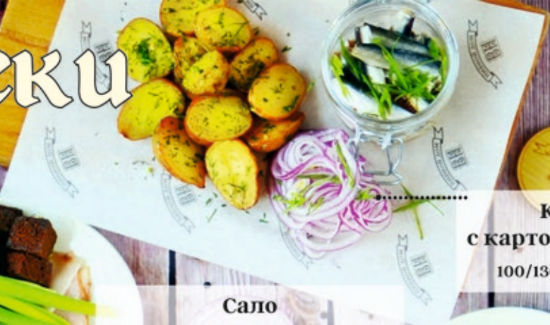
Килька с картофелем бейби 100/130/30 г 270 р.