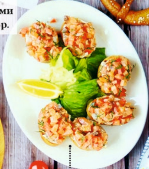
Брускетта с балыком семги 250 г 420 р.