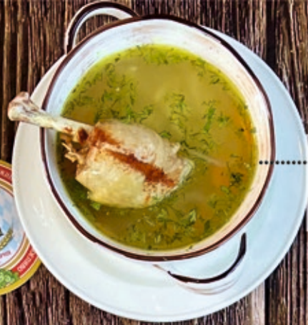
Суп по-домашнему 300 г 330 р