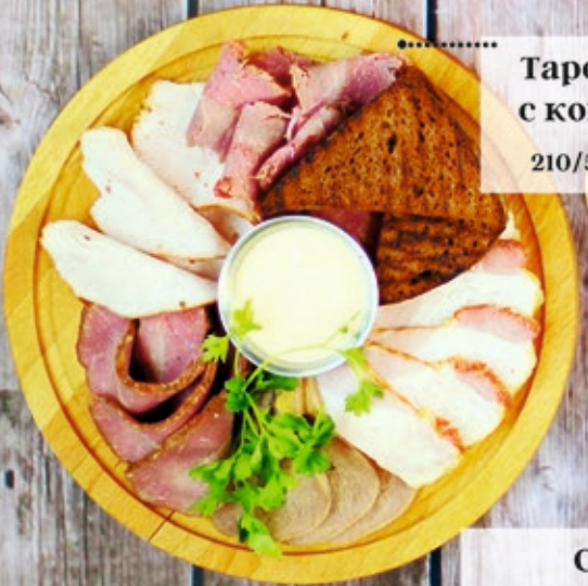
Тарелка мясная с копченостями 210/50/30 г 650 р.