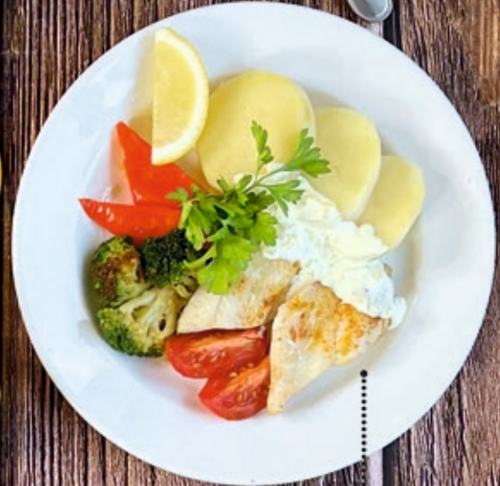
Филе судака в сливочном соусе 100/170/40 г 460 р.